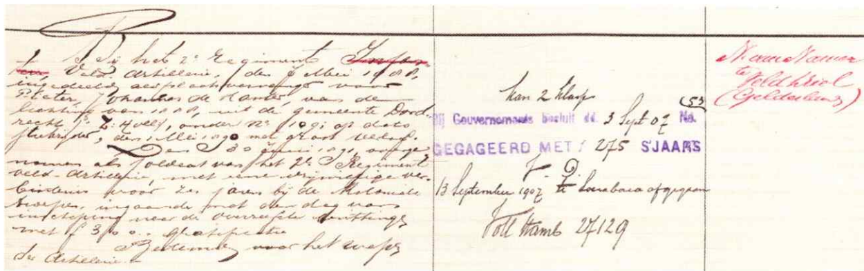
■ Een afbeelding van het uittreksel van de registratie in het stamboek.